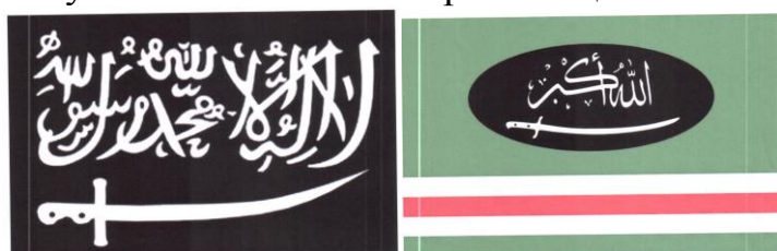
Рисунок 14. Символика вилайетов (административно-территориальных образований) организации «Кавказский эмират» («Имарат Кавказ»).

Отсутствие осознания общественной опасности террористических проявлений подростком может выражаться в наличии в публикациях на его странице или странице его друзей, а также страницах сообществ (групп), в которых он состоит (на которые подписан), информационных материалов, оправдывающих совершение преступлений экстремистской и террористической направленности, в том числе на территории зданий органов государственной власти и местного самоуправления.