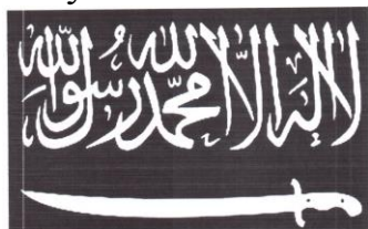
Рисунок 13. Символика организации «Кавказский эмират» («Имарат Кавказ»).