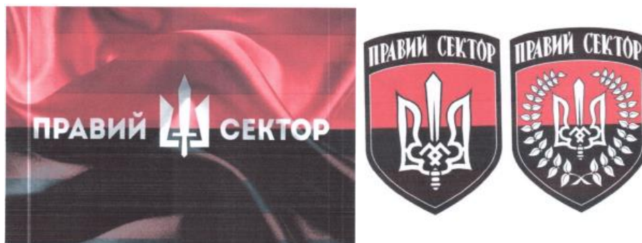
Рисунок 11. Атрибутика организации «Правый сектор».