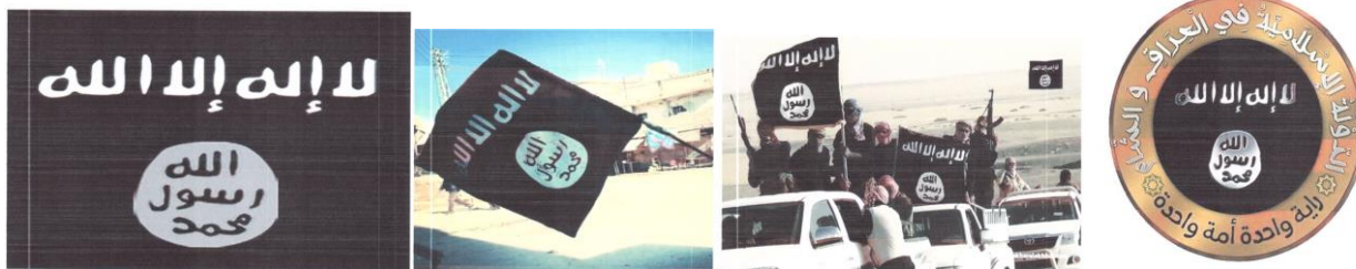
Рисунок 12. Символика организации «Исламское государство».